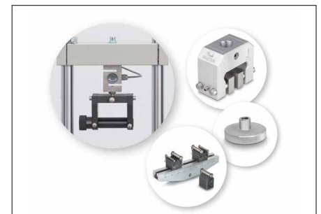
Possibilités de fixation solides et flexibles de nombreux accessoires et pinces de la gamme SAUTER, voir Accessoires