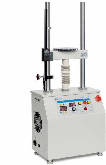
Banc d'essai motorisé incl. dispositif de mesure de longueur LB