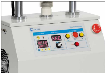
Tableau de commande haute gamme - affichage de vitesse numérique - fonction répétition numérique